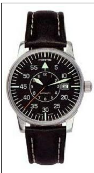
Fortis Flieger Cockpit 40mm